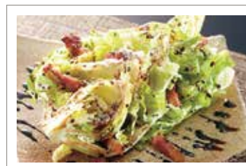
レタスのサラダ ベーコンとバルサミコのソース ￥980 (税込¥1,078)