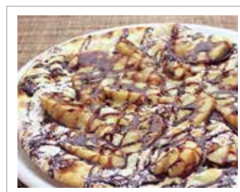
バナナとチョコレートのピッツァ