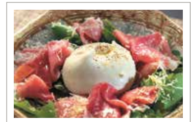
ブラータチーズと生ハムのサラダ ￥2,280 (税込¥2,508)