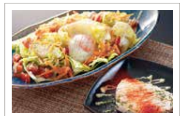
新感覚ツナサラダ ￥1,680 (税込¥1,848)