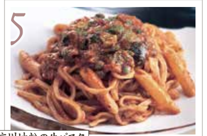
5 信州地粉の生パスタ