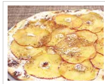
信州リンゴとはちみつのピッツァ シナモン風味

おすすめ ミルクジェラートのトッピング ジェラート1つ ¥ 300 (税込¥330)