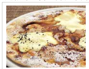
エスプレッソコーヒーと マスカルポーネチーズのピッツァ