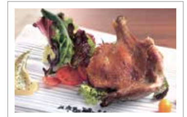
鴨のコンフィ サラダ仕立て ￥2,180 (税込¥2,398)