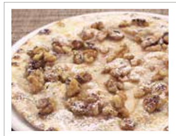
くるみとはちみつのピッツァ