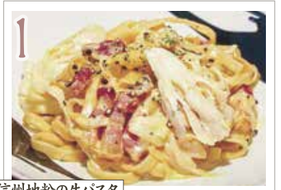
1 信州地粉の生パスタ