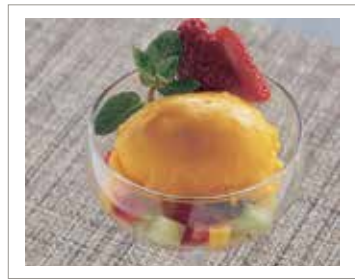
rawマンゴージェラート