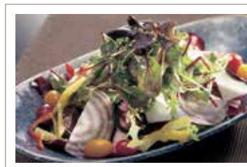
本日の高原サラダ (1～2名様分) ￥800 (税込¥880) (3～4名様分) ￥1,380 (税込¥1,518)