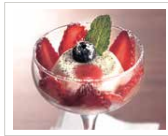
信州いちごのパンナコッタ