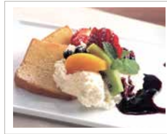
ブルーベリーマスカルポーネ チーズケーキ