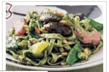
3 信州地粉の生パスタ