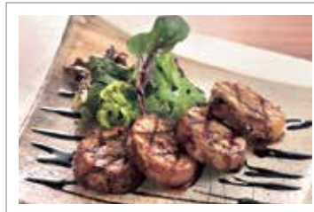
信州ハーブ鶏のロール焼き ￥1,430 (税込¥1,573)