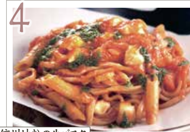
4 信州地粉の生パスタ